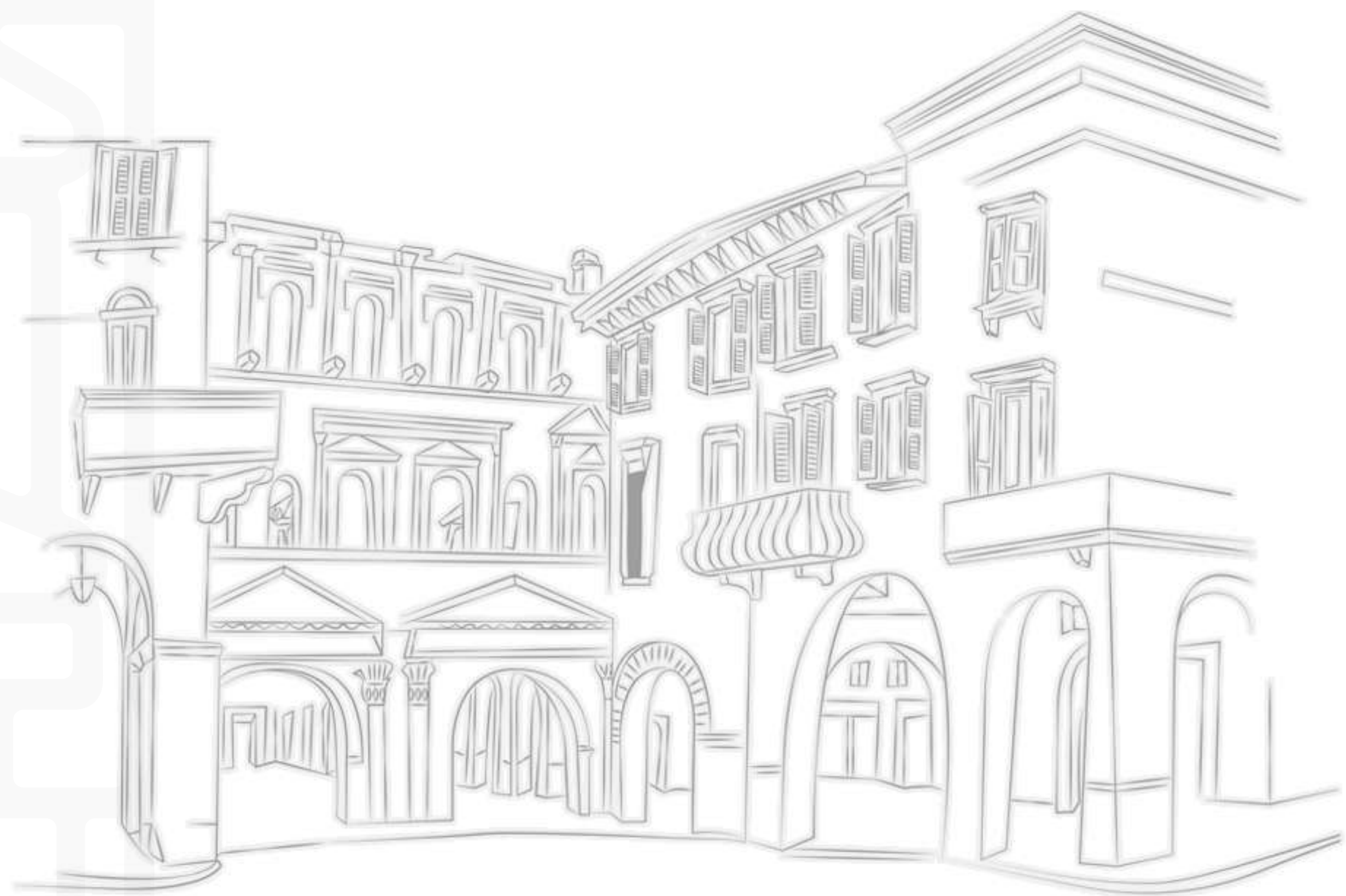
PORTA BORSARI, VERONA

I gioielli che Romeo desiderava, dovevano essere importati in città proprio per l'occasione e sarebbero passati tramite Porta Borsari pagando i dazi.